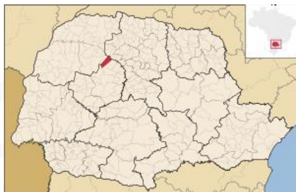
Figura 1: Localização do município de Terra Boa no estado do Paraná

2022. Terra Boa faz divisa com os municípios de Araruna, Doutor Camargo, Engenheiro Beltrão, Ivatuba, Jussara, Ourizona e Peabiru, o que reforça sua posição estratégica na região e permite a articulação de políticas públicas integradas, inclusive no âmbito da gestão de resíduos sólidos urbanos.