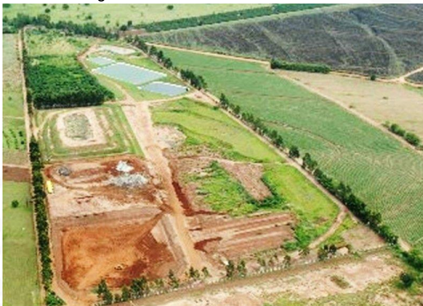
Figura 3 – Aterro sanitário de Cianorte - PR

Como já apresentado no plano anterior o município de Terra Boa participa do consórcio intermunicipal na cidade de Cianorte-PR.