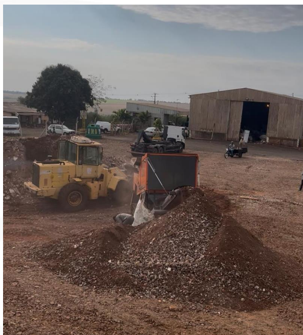
Figura 4 – Área de transbordo